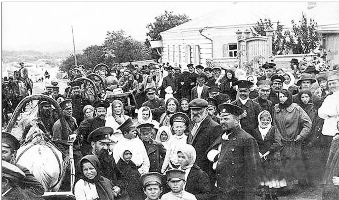
Проводы на войну 1914 года.