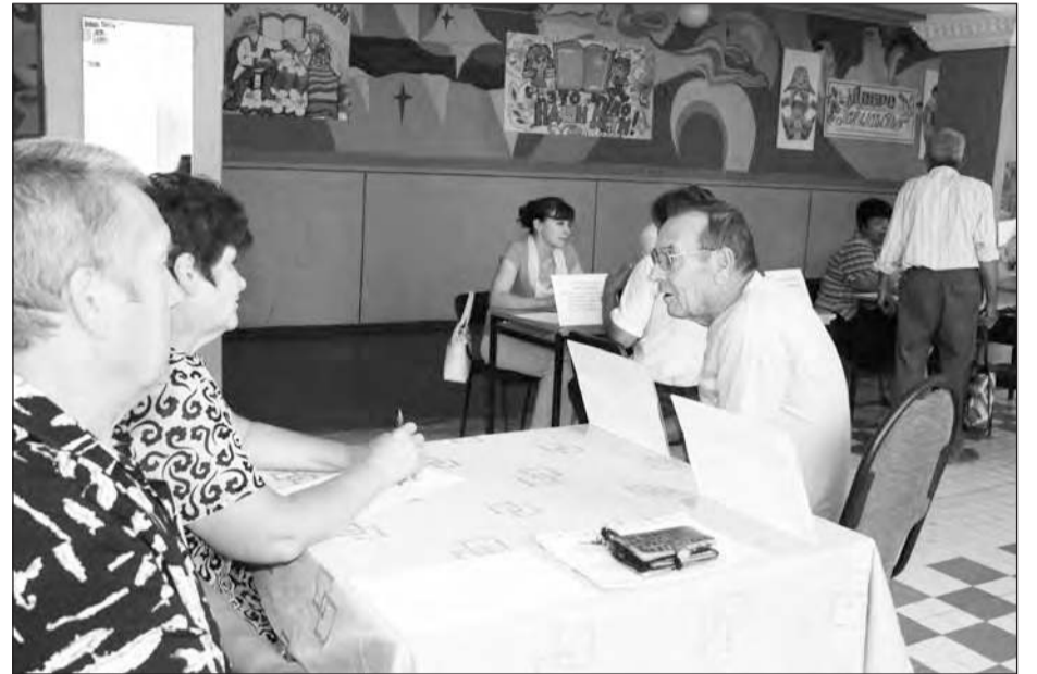
■ Вопросы к властям появились сразу.

Как было разъяснено, даже если бы удалось изыскать необходимые средства (это примерно 2,5 млн. рублей), нет гарантии, что группы малышей будут заполнены: сейчас многие родители возят в город своих детей не только в школы, но и в детсады. А если смотреть в перспективу, то в ней, к сожалению,