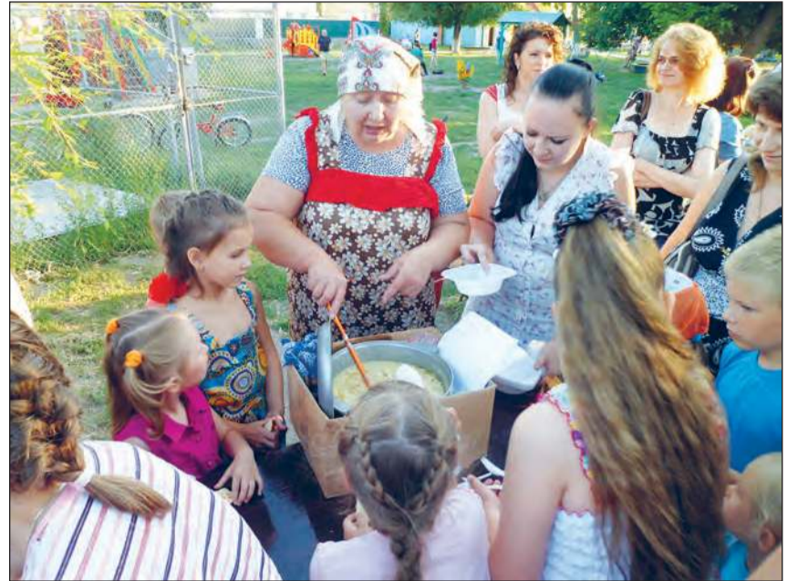
Каша из общего котелка – такая вкуснятина!