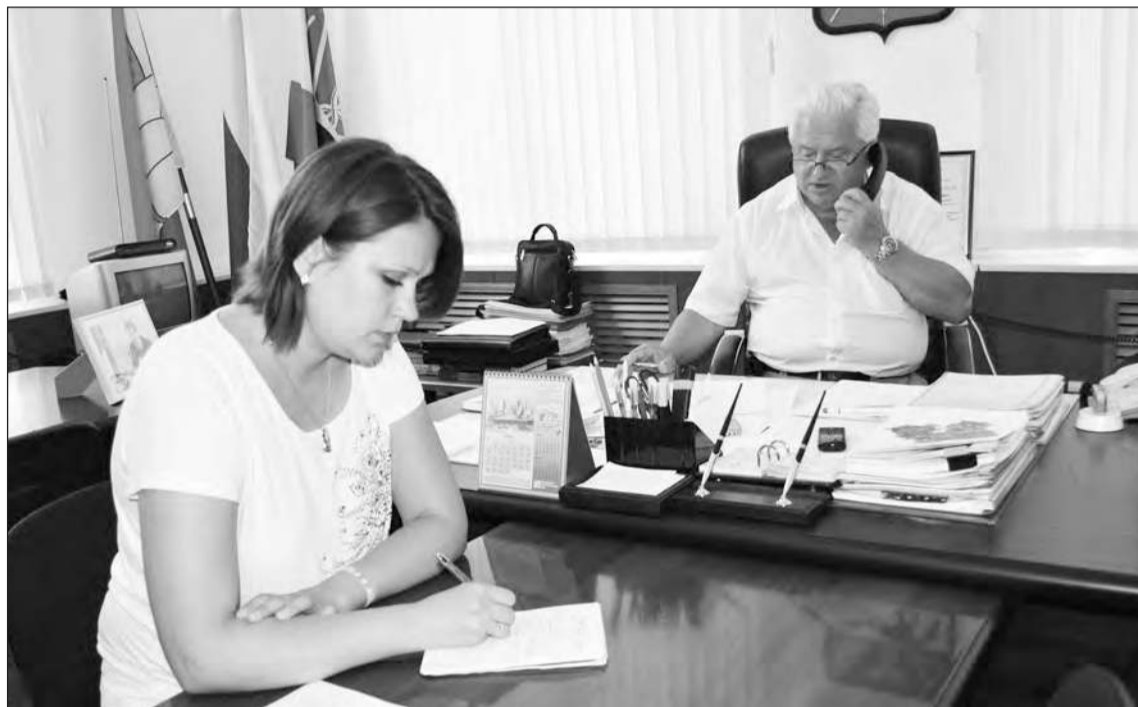
■ В течение часа телефон не умолкал ни на минуту.

– В настоящее время дорога по ул. Дзержинского передана в областную собственность. Обслуживает ее филиал в городе Богучаре ОАО «Воронежавтодор». Администрация города ведет работу с обслуживающей организацией по решению данной проблемы. Несмотря на то, что безопасность на дорогах города относится к компетенции сотрудников ОМВД, мы тоже всячески будем оказывать содействие в этом вопросе.