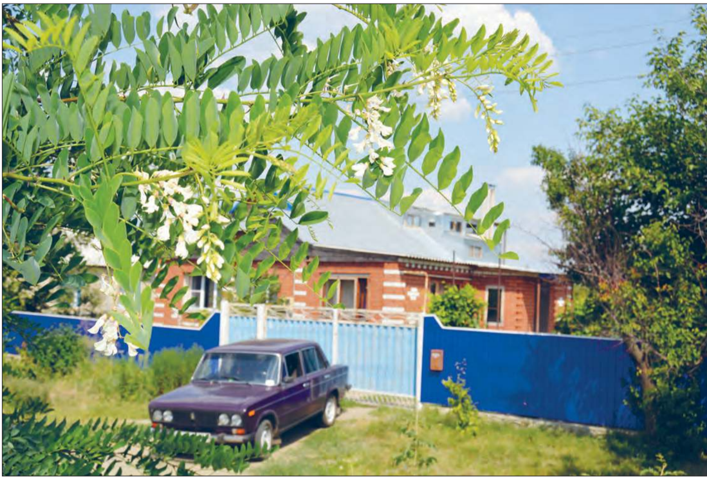
Белой акации гроздь душистые появились второй раз за три месяца.

О природном феномене сообщили жители села Дьяченково