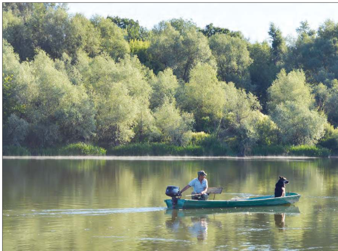
И Дона зеркальная гладь...