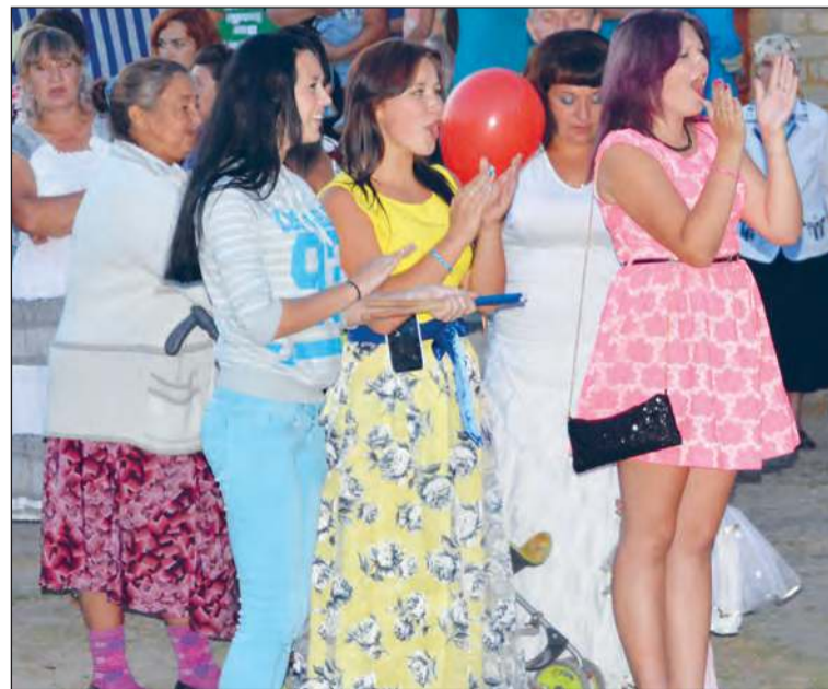
■ Bravo, артисты!